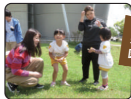
子ども教育学科の 学生と地域の保育 園児との交流